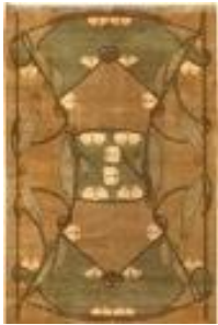
Archibald Knox, 1900

Se presentan cuatro diseños textiles de diferentes estilos. Todos ellos se han basado en un módulo y su combinación para conseguir el diseño definitivo. Siguiendo un esquema modular, haga una propuesta para una alfombra que habrá de tener rasgos estilísticos de uno de los cuatro ejemplos presentados.