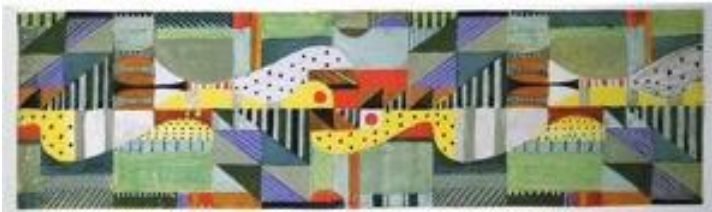
Gunta Stölzl, 1923