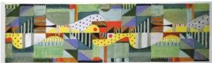
Gunta Stözl, 1923