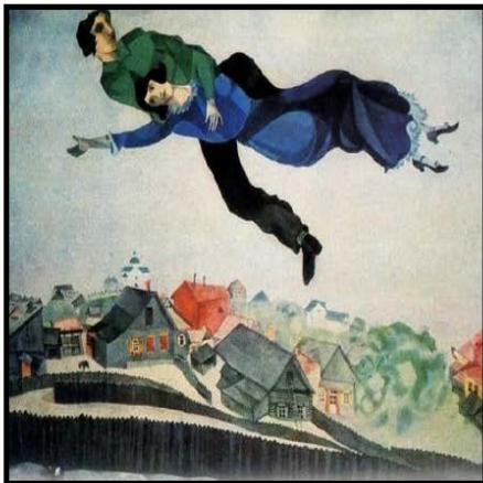
Marc Chagall: Surrealismo

Realice un cartel original, de temática libre, respetando cualquiera de las tres tendencias que en estas obras se ponen de manifiesto. La técnica o procedimientos empleados serán totalmente libres. Explique brevemente la tendencia seleccionada.