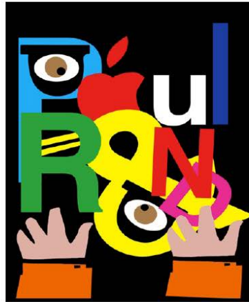
Paul Rand: Vanguardia Norteamericana