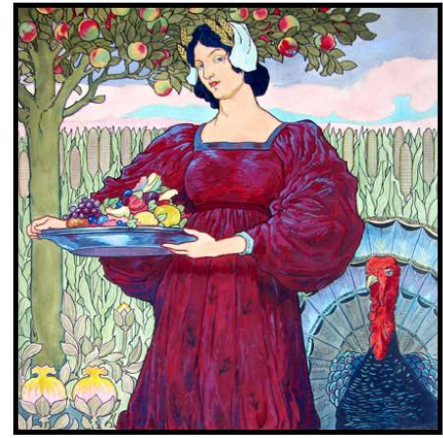
Louis Rhead: Art Nouveau