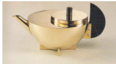
Marianne Brandt, 1924